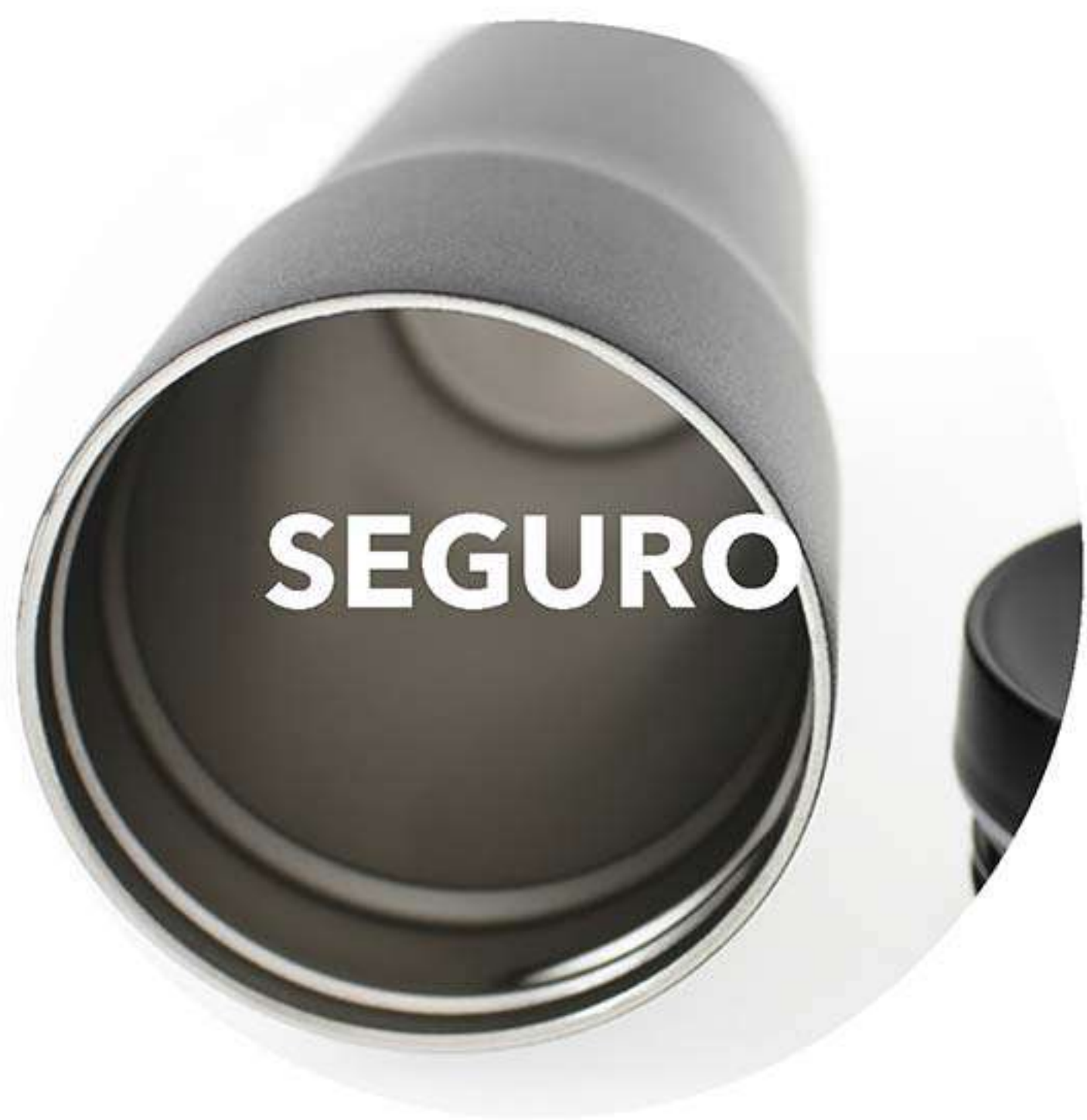
Producto Libre de BPA.