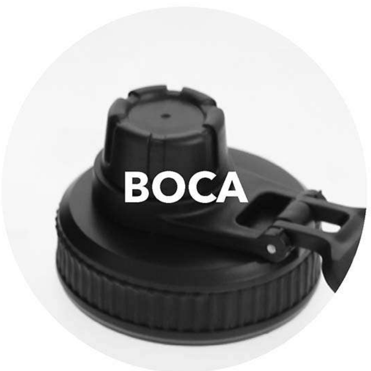
Doble boca con cierre de rosca.