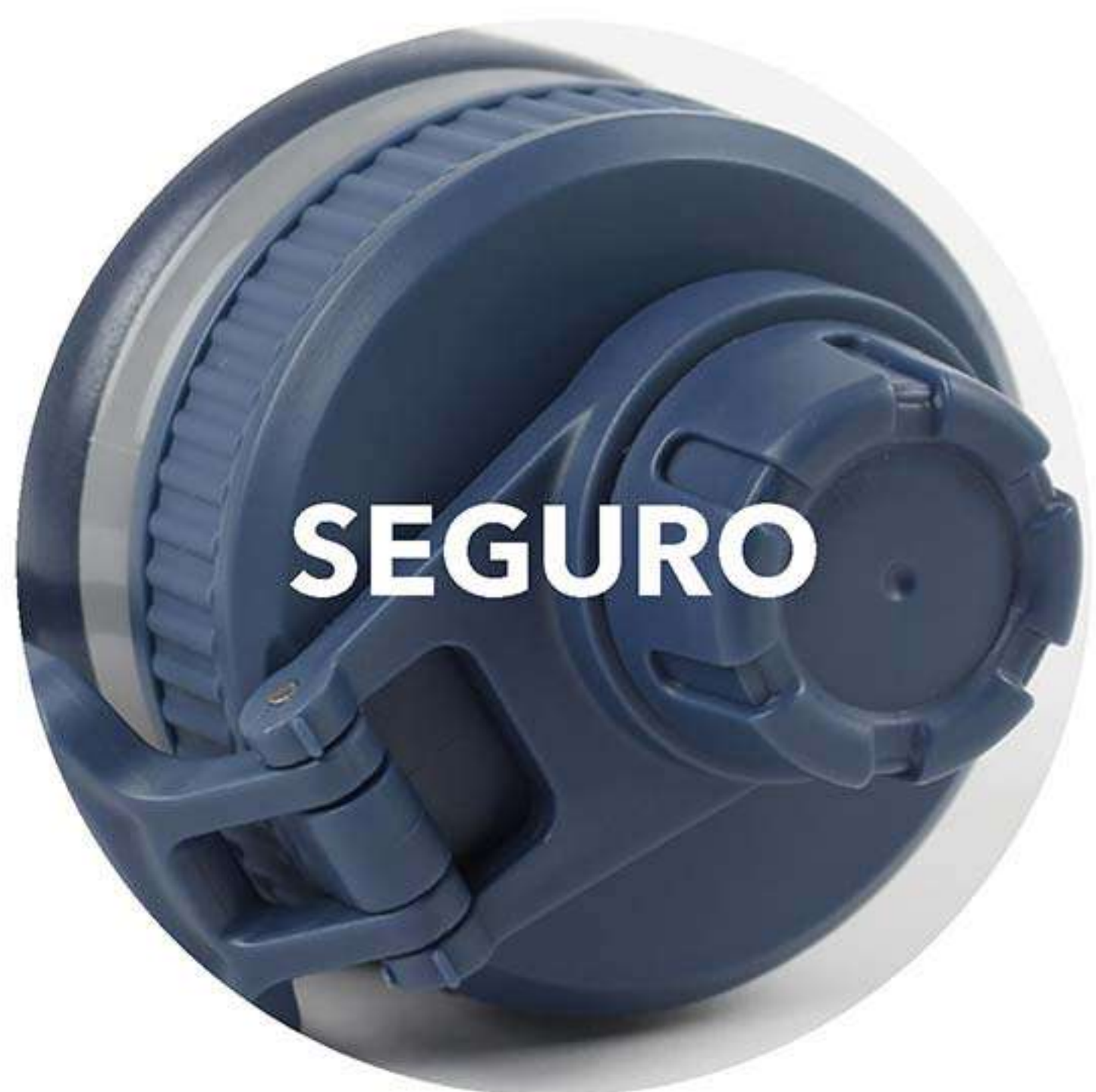
Producto Libre de BPA