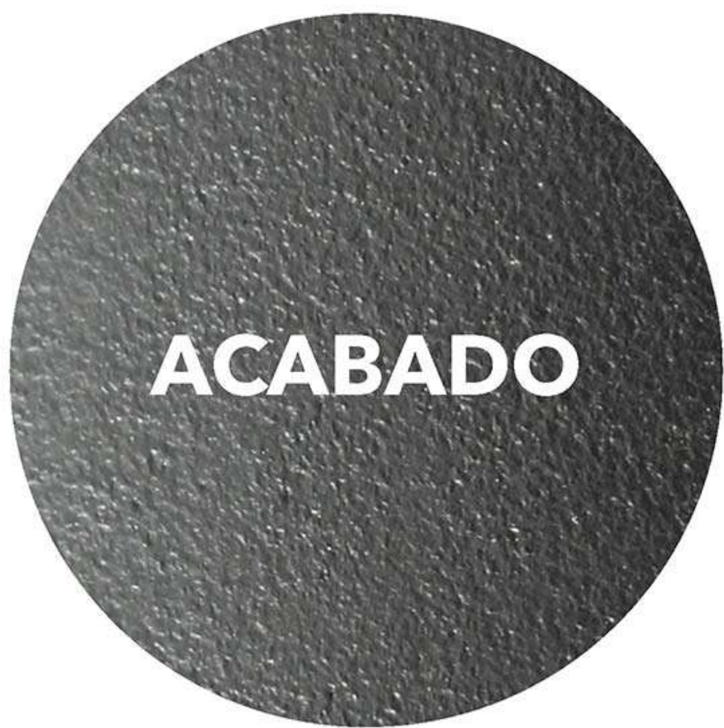
Acabado "Rock" súper resistente.