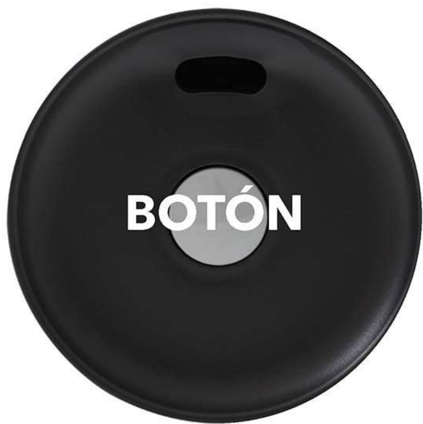
Botón que controla el flujo.